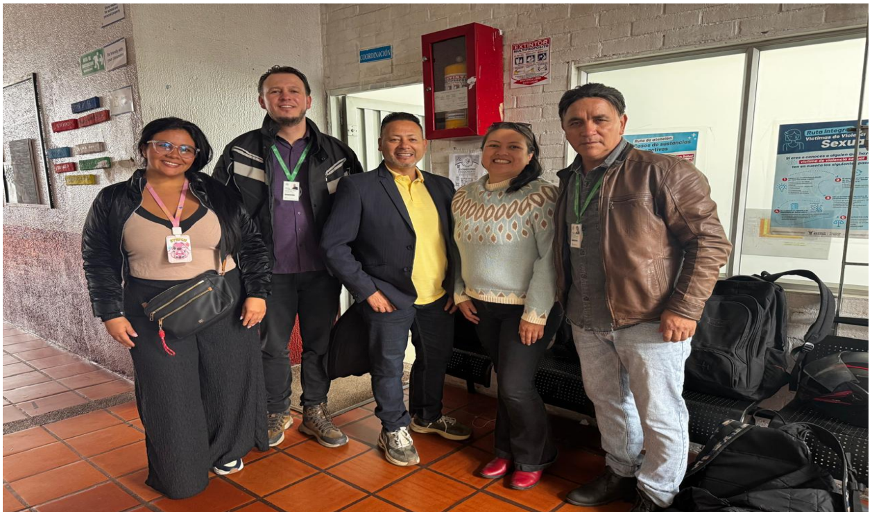
Visita Coordinación miércoles 24 de Marzo I,E Manuela Beltrán