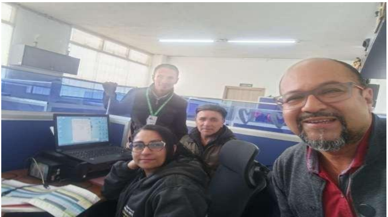
Reunión 24 de marzo institución educativa manuela beltra